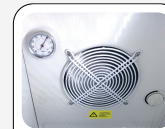
Ventilatore interno di assistenza