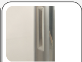
Maniglia schiumatura nella porta