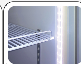
Luce interna LED verticale